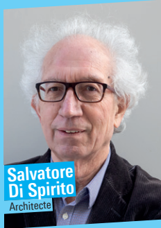
Salvatore Di Spirito Architecte