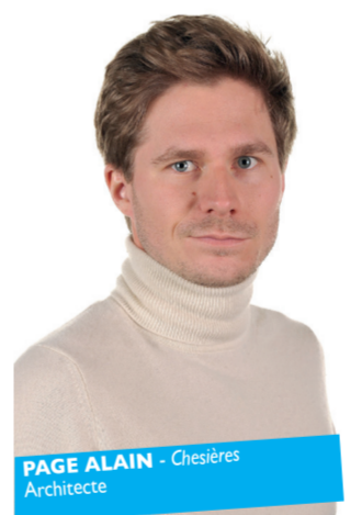
PAGE ALAIN - Chesières Architecte