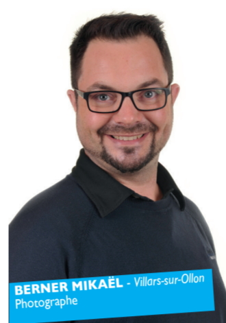
BERNER MIKAEL - Villars-sur-Ollon Photographe