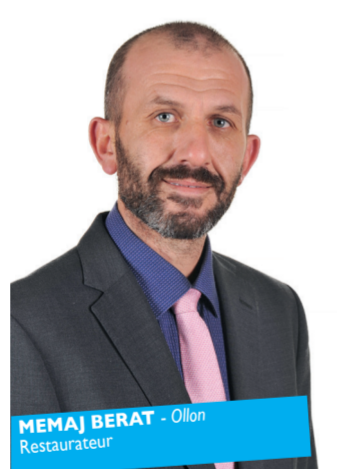
MEMAJ BERAT - Ollon Restaurateur