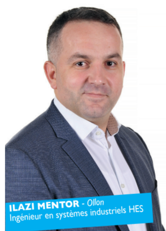
ILAZI MENTOR - Ollon Ingénieur en systèmes industriels HES